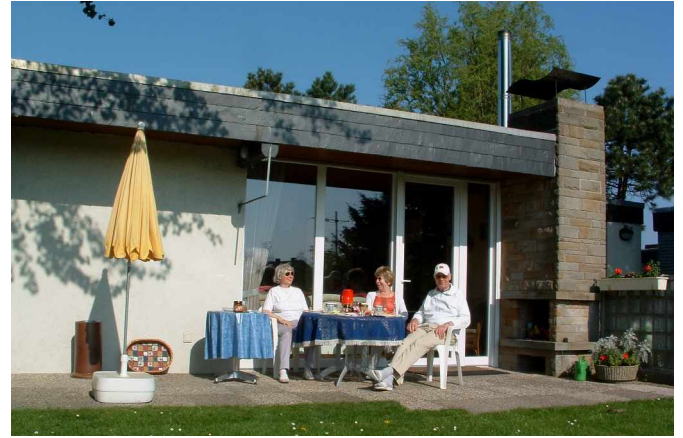
auf der Südost-Terrasse neben dem Kamin