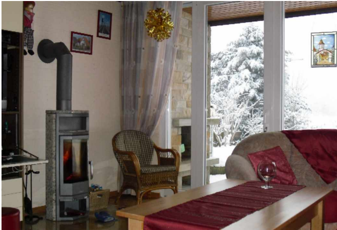
Blick vom Frühstückstisch zur verschneiten Eibe über den Wohntisch