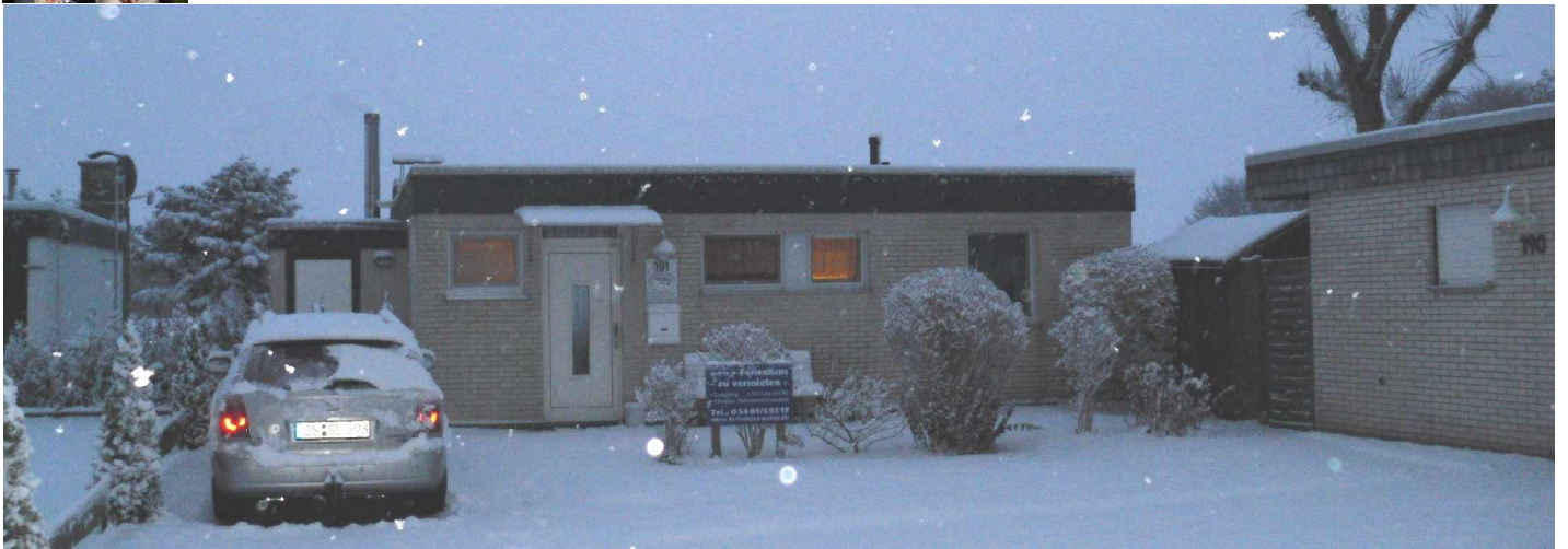
Unser Ferienhaus im Winter: Es schneit

aber mollige Wärme in allen Zimmern. Holzparkett-Fußboden. Zwei Schlafzimmer. Bad+WC. Zweite Toilette