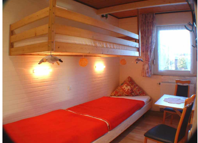
2. Schlafzimmer/ Kinderzimmer: oben 90x200 mit Leitereinstieg, unten 90x400: zwei am Kopfteil verstellbare Lattenrahmen, 2 Matratzen