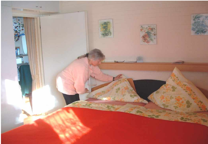
Elternschlafzimmer: 180x210 lang, 2 verstellb. Lattenrahmen, 2 Matratzen