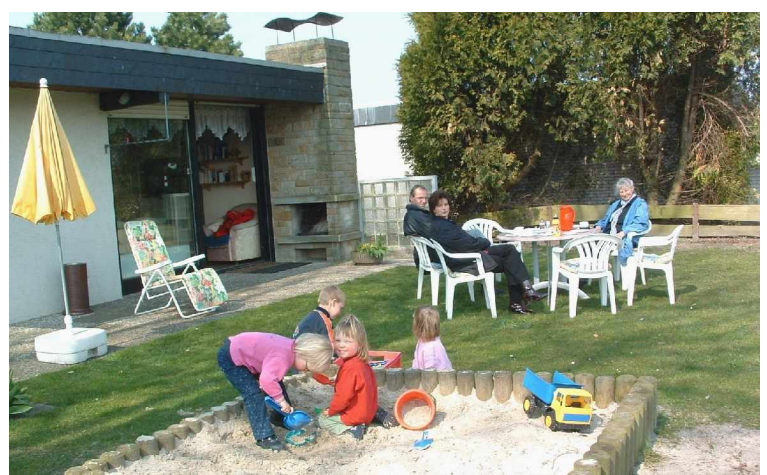
Blick vom Süden über Sandkasten zur 1. Terrasse+Außen-Kamin ins Wohnzimmer