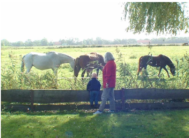
unverbauter Blick aus dem Wohnzimmer z.B. auf Pferdewiese