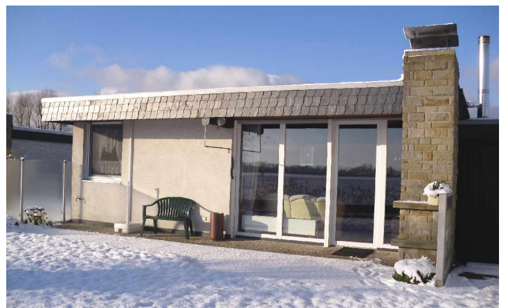
Blick auf die Wohnzimmer-Terrasse