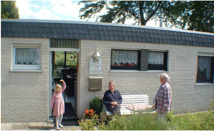
Hauseingang mit Westseiten-Terrasse Von hier aus sind es 200m zum Deich

200 m zum Deich. Ringsum Jalousien. Holzparkett-Fußboden. Zwei Schlafzimmer. Bad+WC. Zweite Toilette