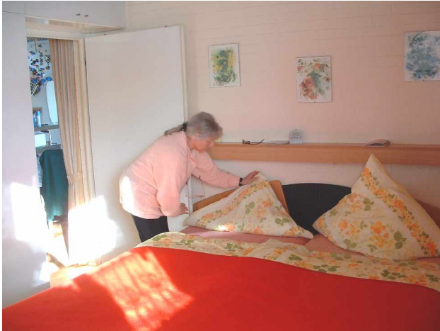
Elternschlafzimmer: 180x210 lang, 2 verstellb. Lattenrahmen, 2 Matratzen ↑Stuhlhöhen-Einstieg↑