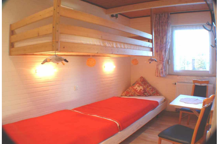
2. Schlafzimmer/ Kinderzimmer: oben 90x200 mit Leitereinstieg, ↑Stuhlhöhen-Einstieg↑, unten 90x400: zwei am Kopfteil verstellbare Lattenrahmen, 2 Matratzen